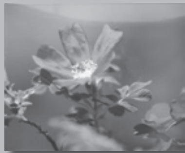
写真部門 「ハマナスの花」