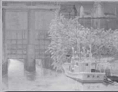
日本画部門 「町の一角」