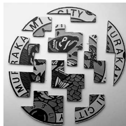
▲市の下水道マンホールがデザインされたパズル