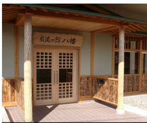
交流の館 八幡 TEL0254-60-5050