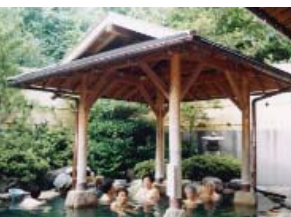
温泉施設 ゆり花会館 TEL0254-77-3991