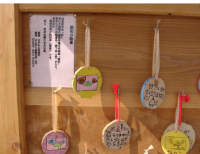
制作体験者の願いを込めて掛けられた絵馬