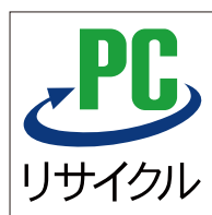
PCリサイクルマーク