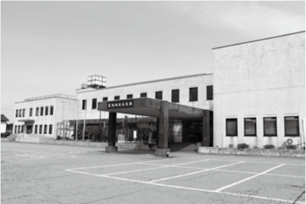
◀老朽化した荒川地区公民館