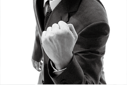
◀地元に戻って働く