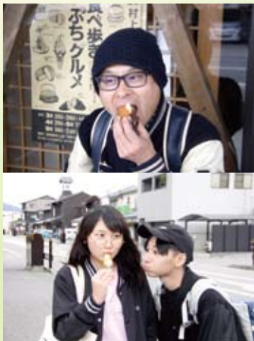
▲今年から始まったワンコインで食べ歩きぷちグルメ。人気の食べ物は、午前中に売り切れてしまうほど大好評。現在、庭百景めぐりでも開催中。