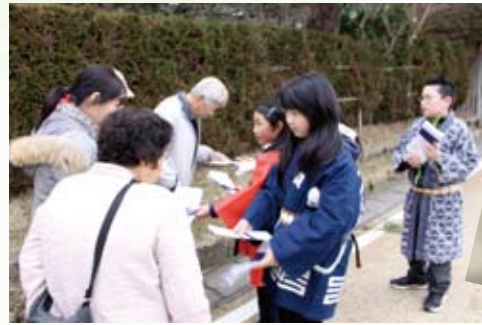
▲村上小学校5年生が手作り観光パンフレットを観光客に（3月4日）