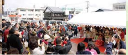
▲駅前歓迎イベントでは甘酒や村上茶がふるまわれた