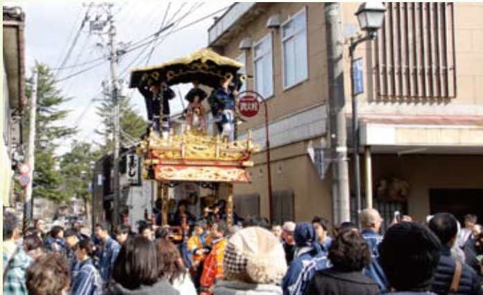
▲トキ屋台の巡行に観光客も大興奮（3月11日）