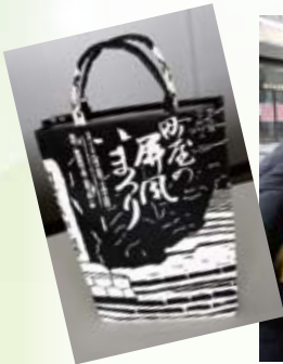
▲村上南小学校5年生が手作り紙バックを観光客に（3月10日）