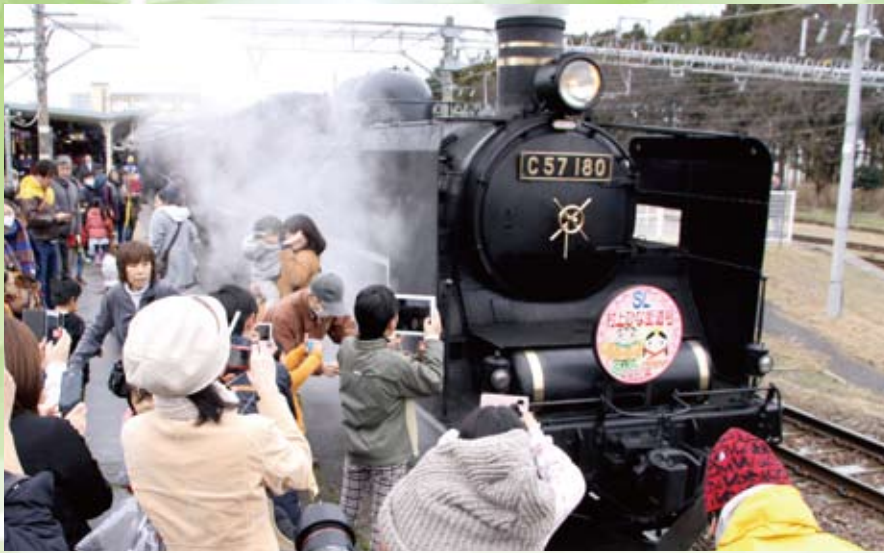
▲「S L 村上ひな街道号」が村上駅に到着（3月25日、26日）