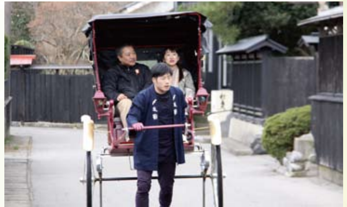
▲黒塀通りでは、人力車の無料試乗でおもてなし（3月25日、26日）