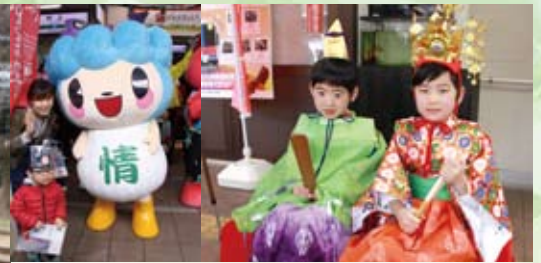
▲ちびっこおひな様やサケリンが観光客をお出迎え