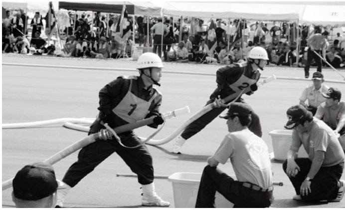
▲昨年(2016年)の新潟県消防大会操法競技会に出場した山北方面隊