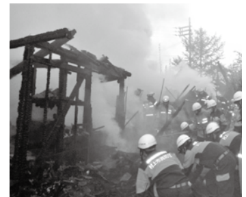
▲障害物を撤去して残り火まで丁寧に放水消火