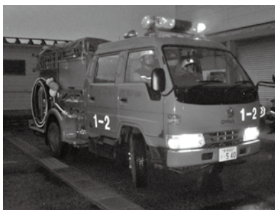
▲火災予防のため警鐘を鳴らして地域を回る消防車両