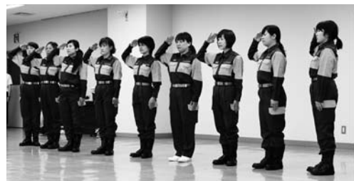
▲消防士から規律の訓練も受けます