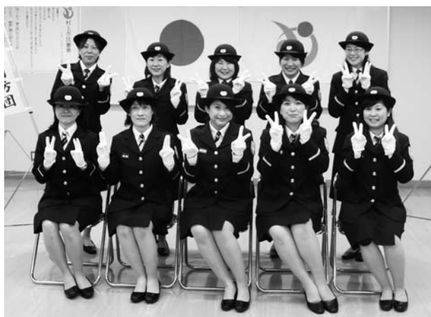
▲広報指導分団の皆さん