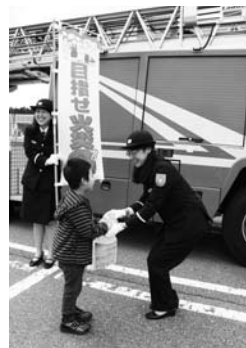
◀◀ショッピングセンター駐車場で火災予防の広報活動

たくさんの人に出会えて、いろいろなことが出来るようになり、自分自身が成長できます。地域の安全安心を支える消防団に、ぜひ入団してください。