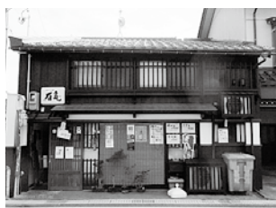
助成金交付の基準適合物件の例 平成28年度は 8 件、総額約240万円を助成しました

統的な様式などを継承した優良建築物などの外観の変更などに対して、経費の一部を助成しています。