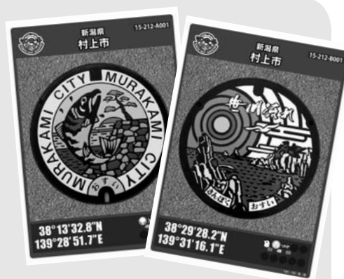
話題のマンホールカード