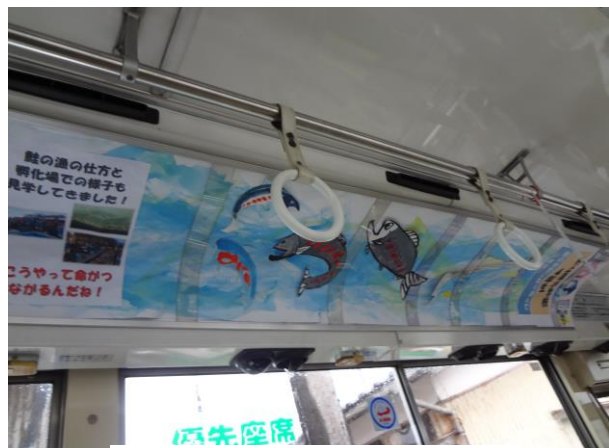
【村上小学校4年生の作品】