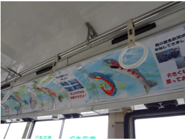
【瀬波小学校4年生の作品】