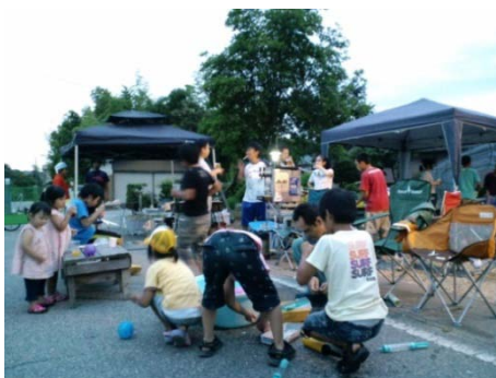
7月23日上中島地藏さままつり

「定住の里づくり」を進めるため、市民協働のまちづくりを「地域の元気づくり」とし、市の職員を各地域に配置した「人的支援」と市の交付金による「財政的支援」により、地域まちづくり組織が中心となり、地域に密着した課題を地域が主体的に解決できる分権型社会を市民の皆さんと進めるものです。