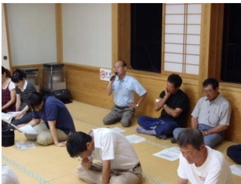
7月20日三面地区住民説明会

7月20日に布部集落センターにおいて、三面地区住民説明会を開催し、まちづくりの概要について市の担当からの説明を受け、質疑応答や意見交換を行いました。