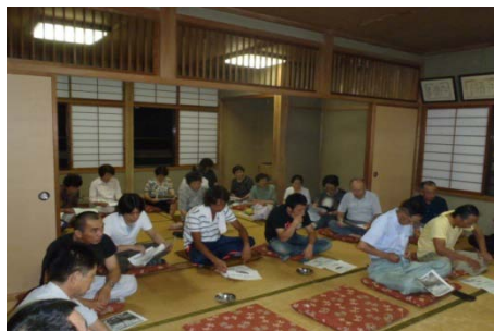
8月2日岩崩集落住民説明会