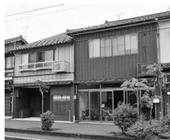
助成金交付の基準適合物件の例 平成29年度は6件、総額約87万円を助成しました

優良建築物などの経費の一部を助成 景観計画区域のうち、歴史や文化、風土などの特色を残している地区に対して重点地区の指定をしています。