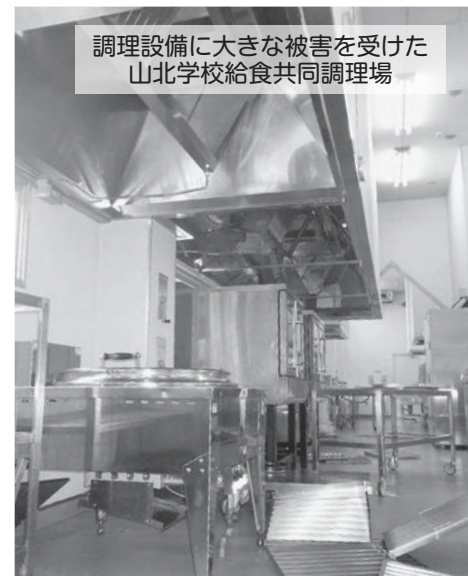
調理設備に大きな被害を受けた 山北学校給食共同調理場