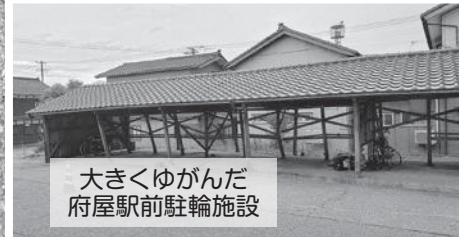
大きくゆがんだ 府屋駅前駐輪施設