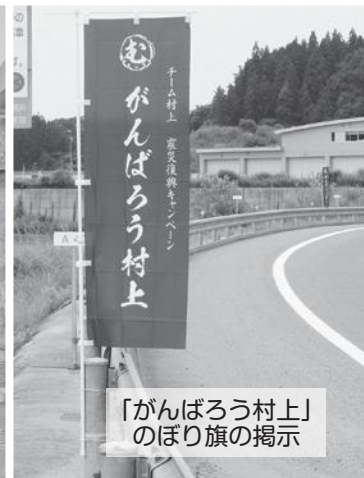
「がんばろう村上」 のぼり旗の掲示