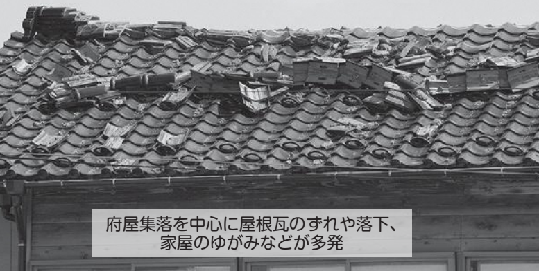
府屋集落を中心に屋根瓦のすれや落下、 家屋のゆがみなどが多発