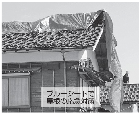
ブルーシートで 屋根の応急対策