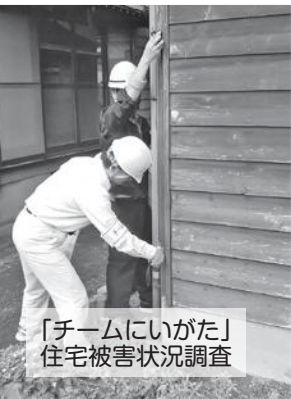
「チームにいがた」 住宅被害状況調査