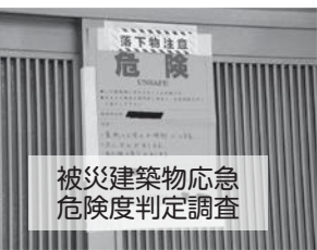
被災建築物応急 危険度判定調査