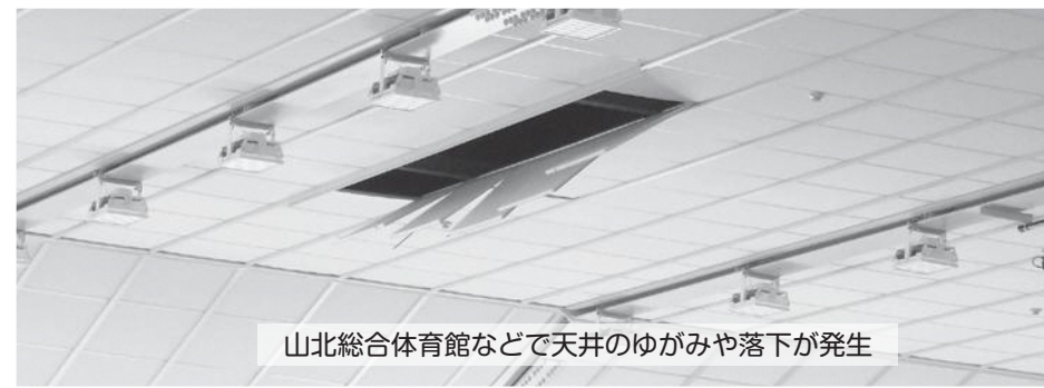
山北総合体育館などで天井のゆがみや落下が発生