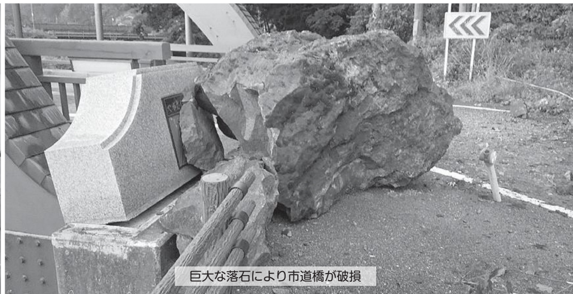
巨大な落石により市道橋が破損