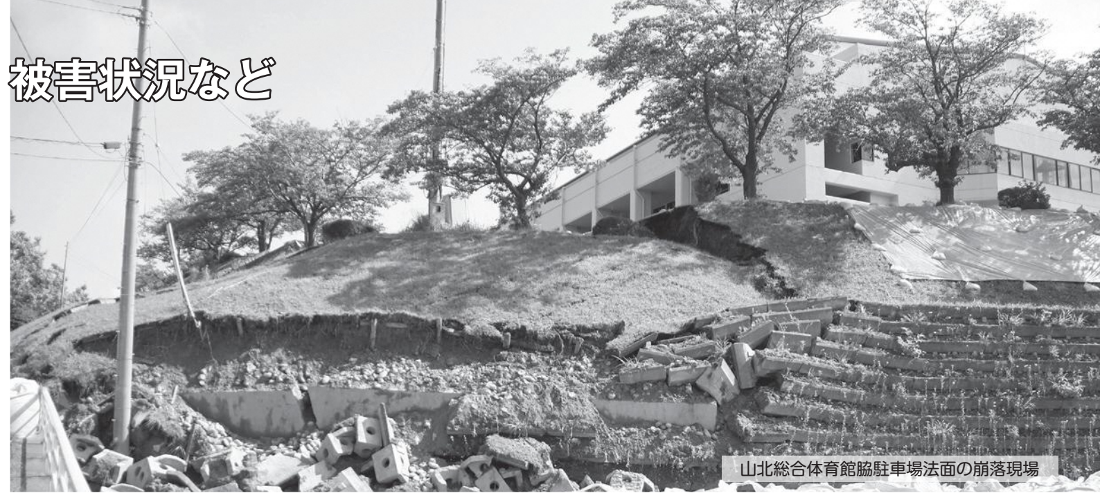
山北総合体育館脇駐車場法面の崩落現場