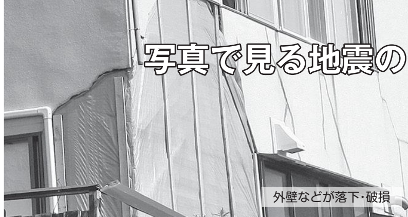
外壁などが落下・破損