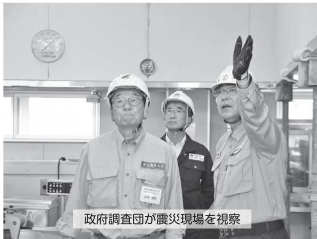
政府調査団が震災現場を視察