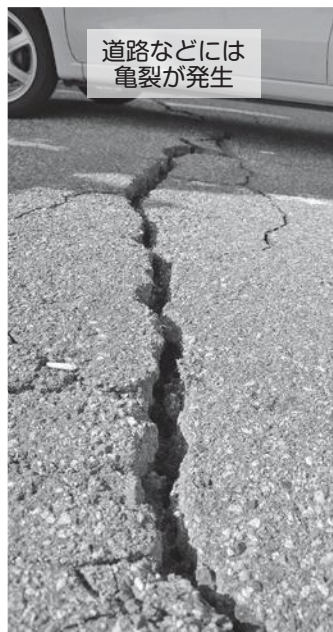
道路などには 亀裂が発生