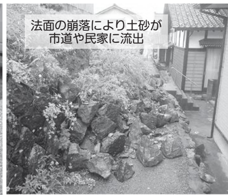
法面の崩落により土砂が 市道や民家に流出