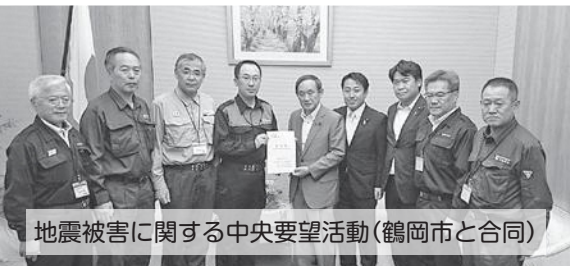
地震被害に関する中央要望活動(鶴岡市と合同)