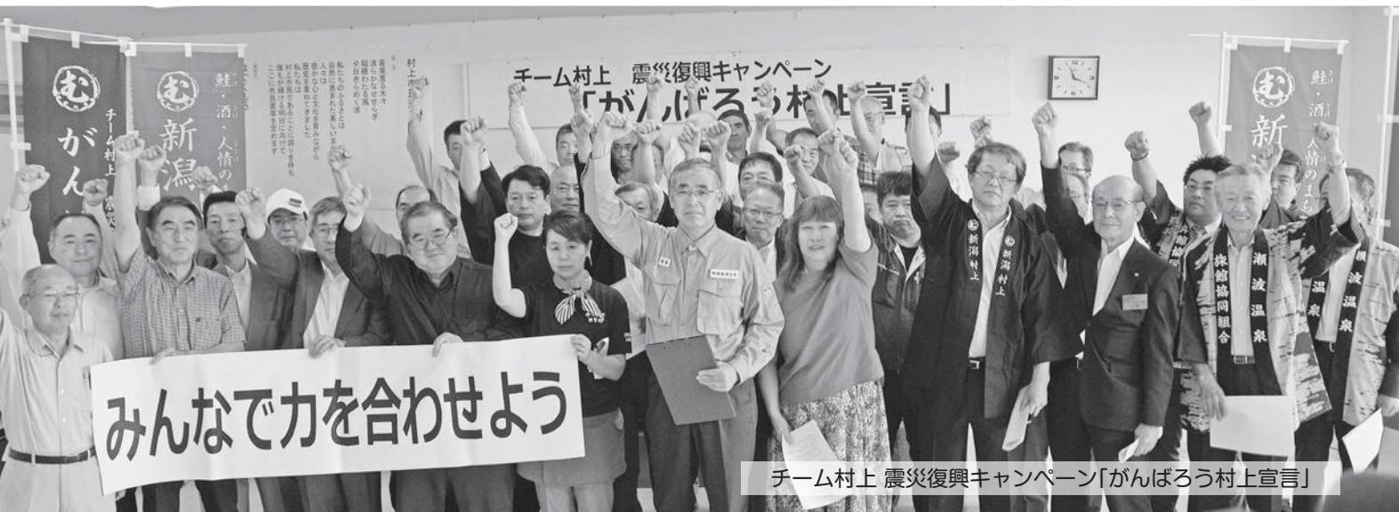
チーム村上 震災復興キャンペーン「がんばろう村上宣言」