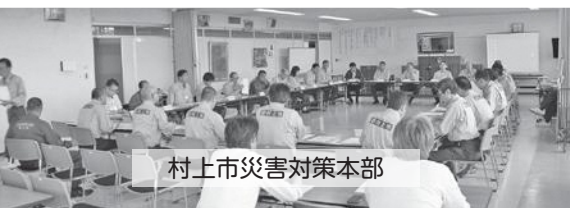
村上市災害対策本部