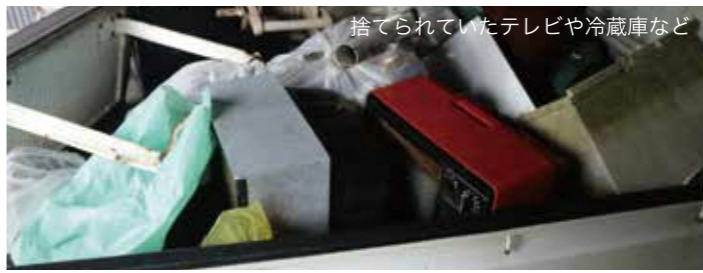
捨てられていたテレビや冷蔵庫など