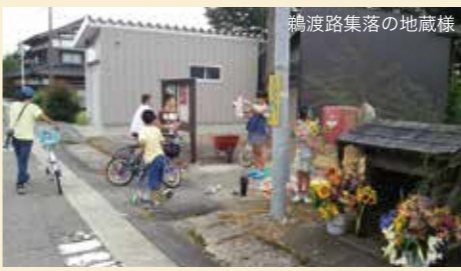
鵜渡路集落の地藏様

鵜渡路集落には、ひとつの集落ではめざらしく4ヶ所も地藏堂があります。今年も子供たちによって、たくさんの花と紙細工を飾り付けられ、賑やかなお堂にお地藏様は喜んでいたのでないでしょうか。また、供えられたお菓子は子供たちに配られ、お地藏様とはまた違う喜びを見せていました。そんなお地藏様はこれから集落の拠り所として末永くこの信仰は受け継がれていくことでしょう。