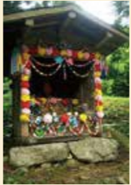
宮ノ下集落の地藏様