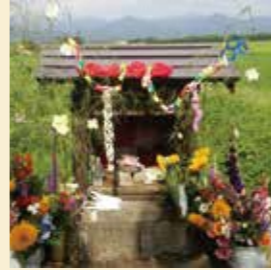
鵜渡路集落の地藏様