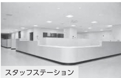
スタッフステーション