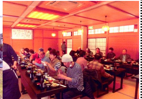
津川・西会津方面 公民館研修旅行 2020.11.14 嵐の晴入り屋敷