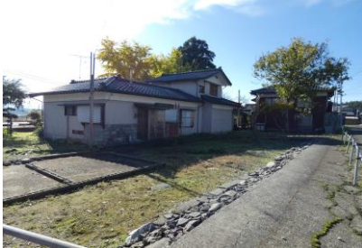
母屋周辺の駐車スペース