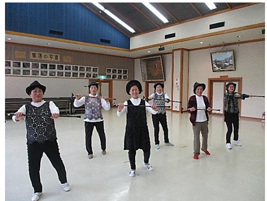
◆撮影時のみマスクを外しています