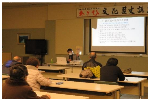
文化歴史講座の様子

海水面の後退により低地に進出できるようになり、自然と共存しながら石器をつくり、木の実や川魚、動物を加工し調理していた暮らしぶりを聴き、想像が膨らみました。参加者からは、「とても奥深く興味深い内容でした」と感想をいただきました。