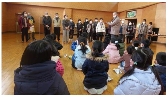
先生となった長寿大学の学生