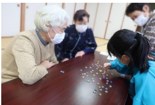
おはじき体験の様子

小学生のみなさんからは「とても楽しかった」という感想を、長寿大学の学生さんからは「次回はもっと長い時間でやりたい」とご意見をいただき、全員が充実した時間を過ごすことができました。