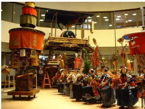
図 郷土資料館の展示

今後も、これら施設においては、歴史資料等の展示公開やイベントを開催し、市民や来訪者に対し当市の歴史的風致に接する機会を提供しつつ、今後も、文化財の所有者や管理者との連携や協力のもと、創意工夫により展示内容の充実を図り、保存、活用や展示公開の推進による普及啓発に努める。また、これらの施設が、各所に点在していることから施設相互の連携、協力を図りながら有効な利活用に向けた取組を検討する。