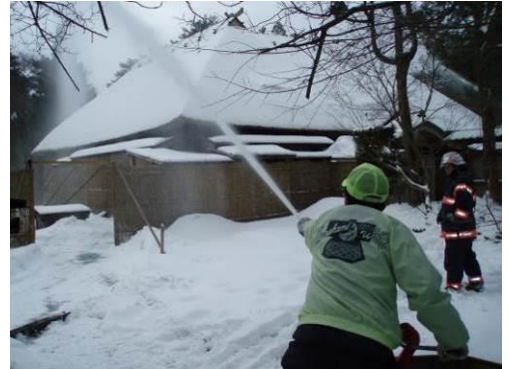
図 若林家住宅における消防訓練

近年、指定文化財などへの落書きや破損なども問題となっていることから、若林家住宅や旧嵩岡家住宅などの市有文化財については、定期的に巡回し異常の有無などの点検に努め、警察署と連携を図りながら状況に応じた適切な対応を図る。