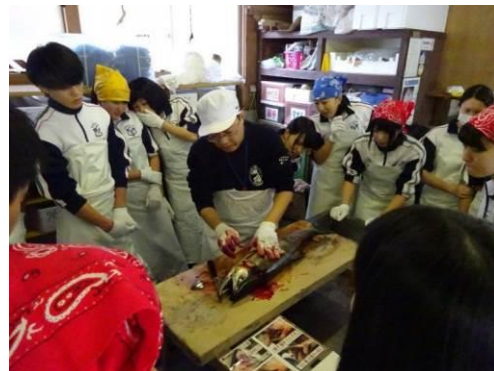
図 塩引き道場の様子