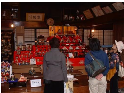
図 町屋の人形さま巡り

今後も、これらのまちづくり団体等と相互連携を図りながら必要な情報を提供し、文化財等の公開活用や歴史、文化に関する普及啓発を推進する。