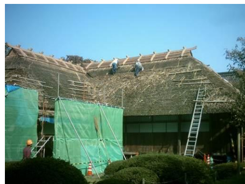
図 若林家住宅の茅葺き屋根の修復