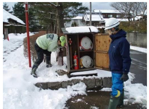
図 文化財に設置された消防設備