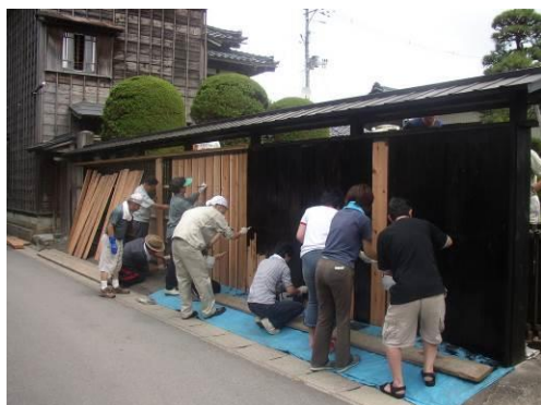
図 黒塀プロジェクト

今後も、各地域のまちづくり組織と連携を図り、各地域のまちづくり組織以外の各種団体については、多様な活動をさらに推進するため協議、連携を図りながら必要な情報を提供し、人材の育成や支援の充実を講じるなど官民一体となった文化財の保存及び活用体制の構築を目指し検討する。