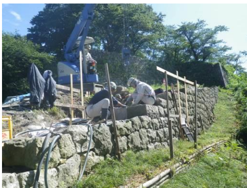
図 村上天跡の石垣の修復

史跡である村上天跡の修理、整備については、「史跡村上天跡整備基本計画」に基づき実施する。また、重要文化財である若林家住宅や浄念寺本堂、市の指定文化財である旧嵩岡家住宅等の指定文化財等については、現状修理を基本としながら文化財として価値の確実な保存を図る。