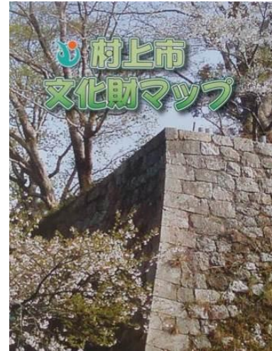
図 村上市文化財マップ

また、文化財の公開活用に推進し、所有者や管理者等と協議、連携しながら誰もが文化財を気軽に見学し親しむことのできる機会を検討する。また、各地域のまちづくり協議会や民間まちづくり団体と相互連携を図りながら、文化財等の公開活用や歴史、文化に関する普及啓発を推進する。