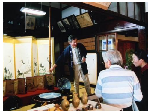
図 町屋の屏風まつり