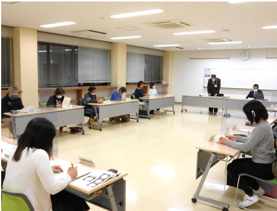
協力員会議（全体会）の様子