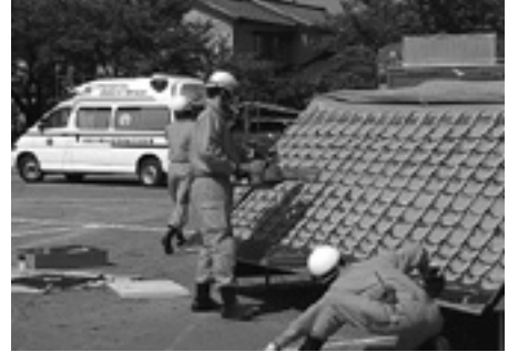
昨年の山辺里小学校での防災訓練の様子

防災無線は日ごろから点検を行い、きちんと鳴るか確認を行ってください。また、むらかみ防災・防犯情報ねっと（本誌裏表紙参照）で、携帯電話などにメールで受け取ることもできます。