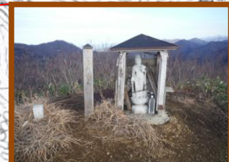
山頂634m 安置された観音様