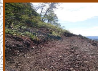
H30に伐採作業を行った ため、一部作業道を歩き