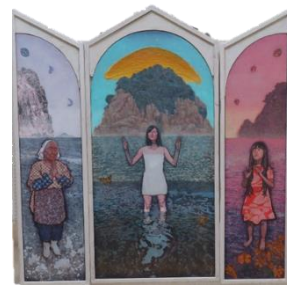
千五百秋（ちいおあき）