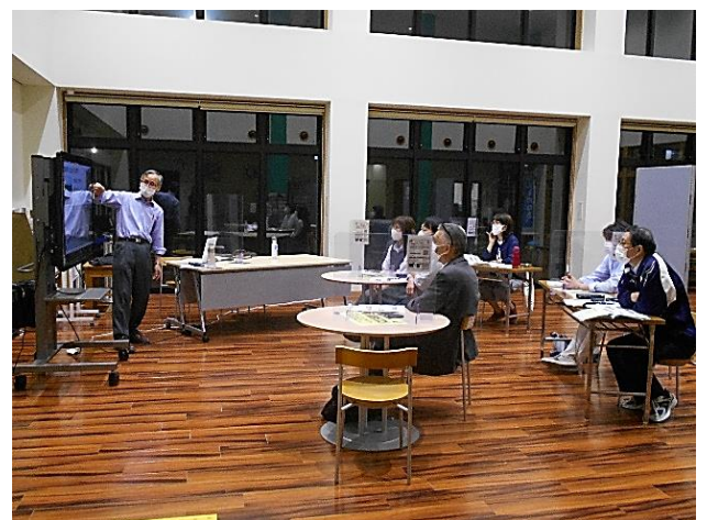
講座の実施に向けて熱心に学習する協力員の皆さん