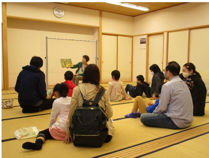
子どもたちも絵本の世界に入り込んでいます

次回の読み聞かせは、6月20日（日）の午前10時から荒川地区公民館で開催予定ですので、皆さんぜひお越しください。