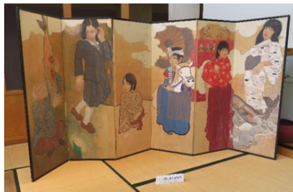
村上郷土美人図屏風