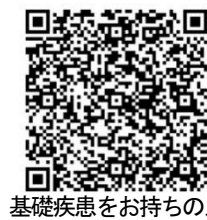
基礎疾患をお持ちの人の 自己申告はこちら