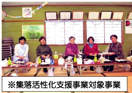
※集落活性化支援事業対象事業