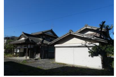
母屋と車庫兼物置