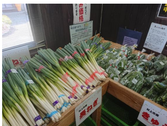
村上市内にある農産物直売所

今後も消費者にとって、地場産農林水産物を身近なものにするため、直売所や量販店における農産物コーナーの充実や出荷体制の整備、学校給食、保育・保健福祉施設、飲食店、宿泊施設において、地域で生産される地域食材の利用が高まるよう推進すると共に、良品質な地元産の農林水産物の安定生産と利用拡大を図ることも必要です。