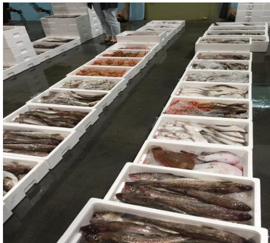
寝屋漁港で水揚げされた鮮魚