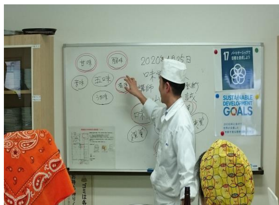
地元料理人が講師を務めた料理講習会