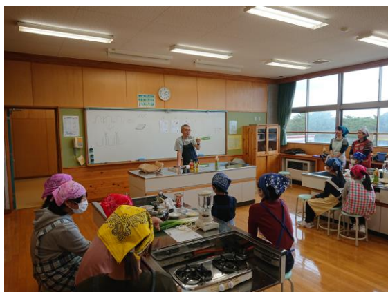
小学校での食育講座

家庭・学校・地域における一体的な食育の取組を推進すると同時に、食に対する知識や伝統を生活の中心である家庭において、親から子へと教え、育むことができるよう啓発を行うことが重要です。そして、新鮮で安全安心な旬の地場産農産物や地域食材を利用した食生活や健康づくりに取組むことで、市民自らが心と身体の健康を守り、人生を豊かに生きる力を育むことが必要となっています。