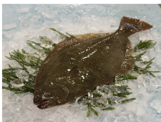
岩船港に水揚げされた「白皇鯉」