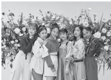
Little Glee Monster