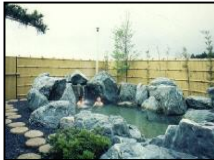
朝日まほろば温泉

農園から歩いてすぐ隣に「朝日まほろば温泉」と、プール施設「朝日きれい館」があります。温泉やプールに入って、農作業の汗をさっぱり洗い流せます。