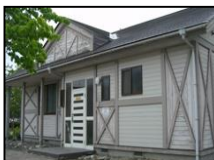
コテージ（宿泊施設）

農園のすぐ隣にある13のコテージは温泉つきで、大勢の家族でも泊れます。コテージに泊まって、のんびりと農作業はいかがですか。（宿泊は予約が必要です）