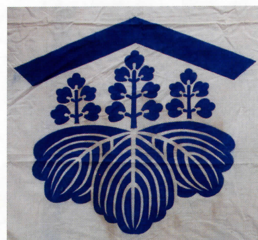
あゆかわ いおり うち ざり とう 鮎川氏家紋「庵の内に桐の臺」