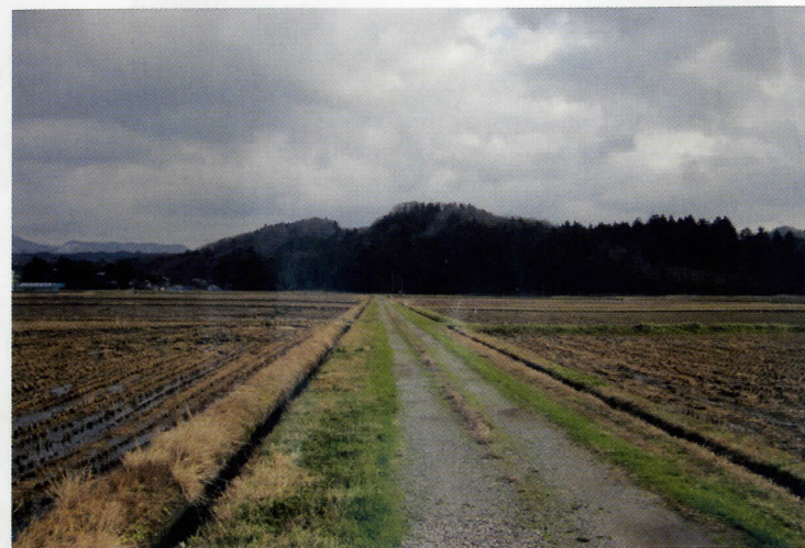
大葉澤城跡を西から望む