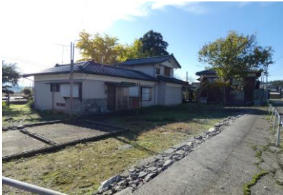
母屋周辺の駐車スペース