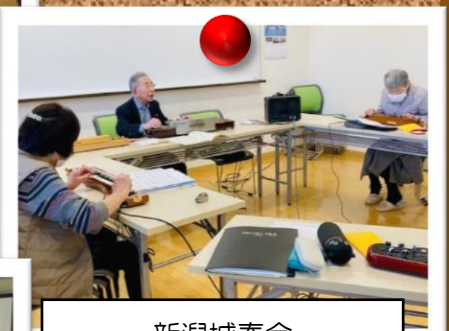
新潟城春会 大正琴体験会