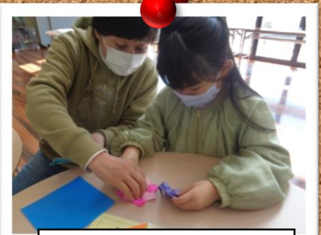
ほっとみるくの会 くるくる回るコマ作り