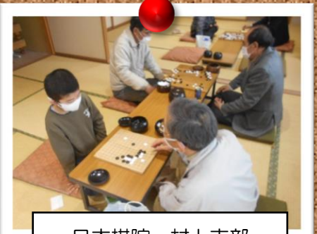
日本棋院 村上支部 囲碁体験会