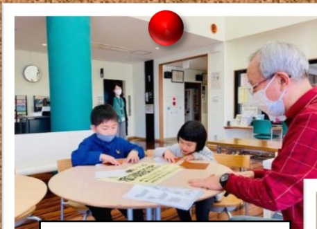
ゆめ・しかく 遊べる折り紙づくり