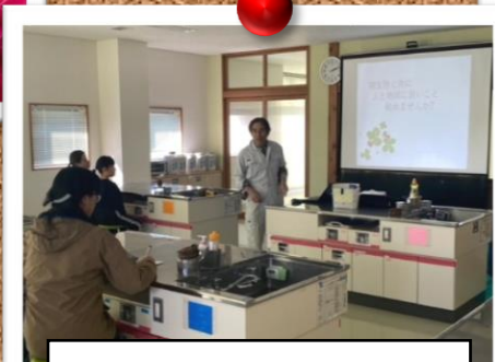
いわふね地域エコセンター EM菌学習&ボカシ作り