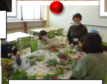
野の花会 荒川教室 生け花作り