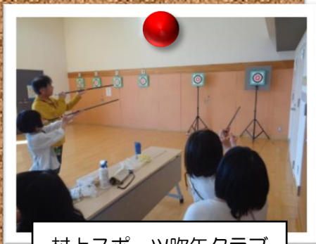
村上スポーツ吹矢クラブ 吹矢体験会