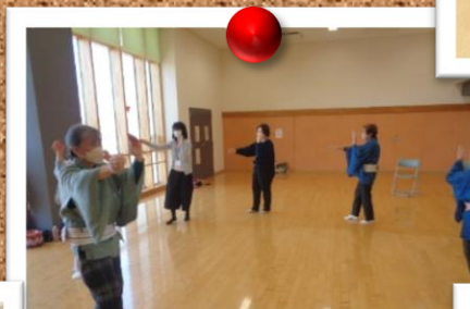
桜踊会 村上市民音頭レッスン