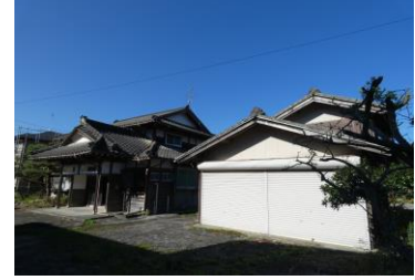
母屋と車庫兼物置