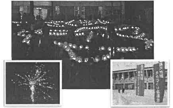
朝日さくら小スノーフェス