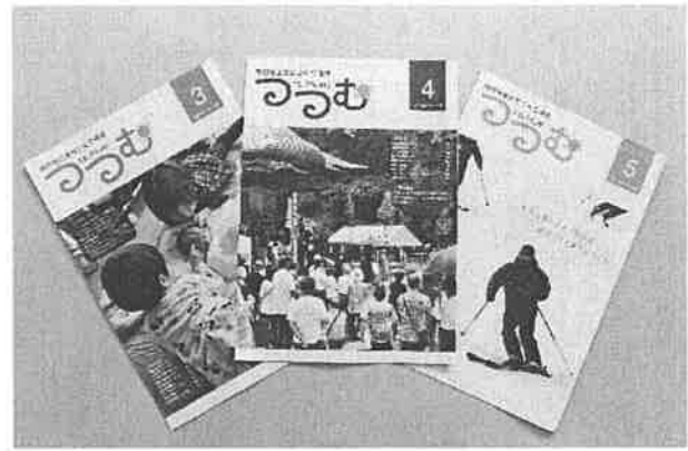
合同広報紙「つつむ」