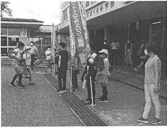
あいさつ+1（プラスワン）運動