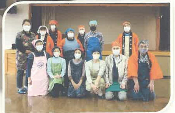
令和4年度料理交流会『そば打ち体験』の様子