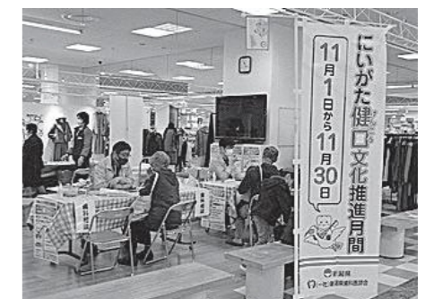
▲昨年度の「村上市岩船郡健口フェア」の様子