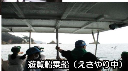
遊覧船乗船（えさやり中）