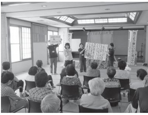
人権擁護委員 地域の茶の間での活動