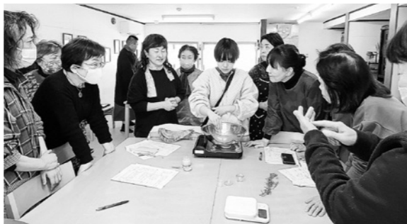
▲ローズマリーの活用について学ぶ参加者

研修では、ローズマリーを活用したハンドクリーム作りや、ローズマリークッキーを試作して試食しました。研修に参加した人は、「ハーブは、観賞で楽しめるだけでなく、さまざまな利活用ができるところが利点。今回学んだことを生かして、楽しみながらまちづくり活動の幅を広げていきたい」と話していました。