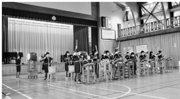
▲力強い演奏を披露する児童たち

さんぼく小学校の3年生が地域を学ぶ「さんぼく科」の一環で、伝統ある日本国太鼓に取り組み、その成果を披露しました。