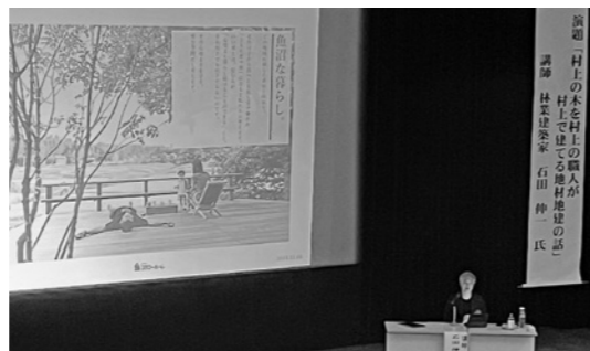
▲地域の材料を豊富に使った建築事例を紹介

また、手入れが不十分で節があり、積雪の影響でS字に曲がった杉の木も、欠点と考える部分を魅力としてアピールすることで、余すことなく杉の木を利用できるといった話もあり、地域の可能性が膨らむ講演となりました。