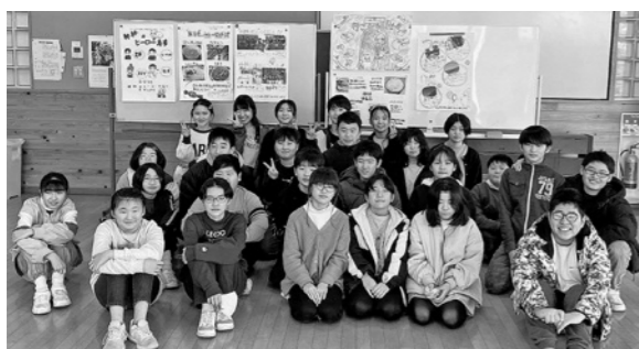
▲作成したポスターをバックに集合写真

自分が住んでいる地域へ愛着をもってもらいたいという思いから、平林小学校6年生(令和5年度卒業生)が「神林ファンを増やすために自分たちができることは何か」をテーマに昨年9月から地域について調べ、魅力をまとめた「魅力発信ポスター」を作成しました。