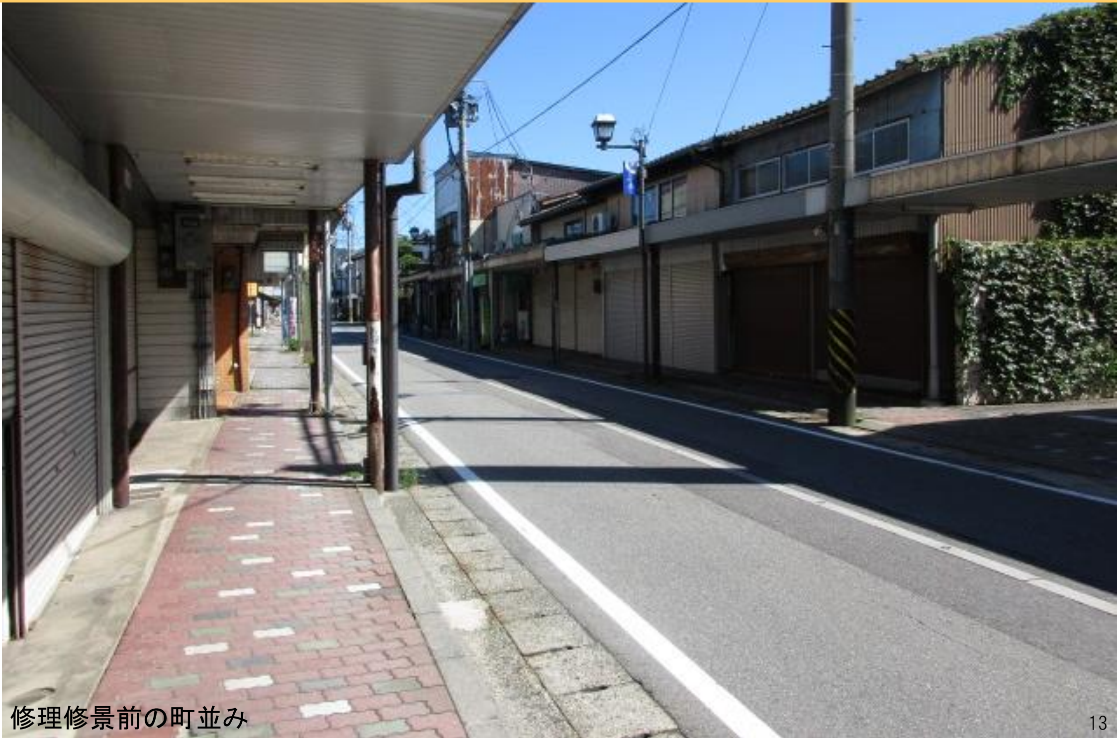
修理修景前の町並み