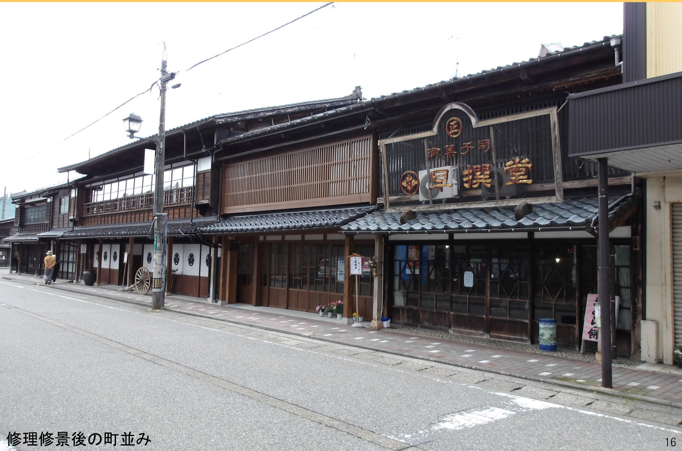
修理修景後の町並み