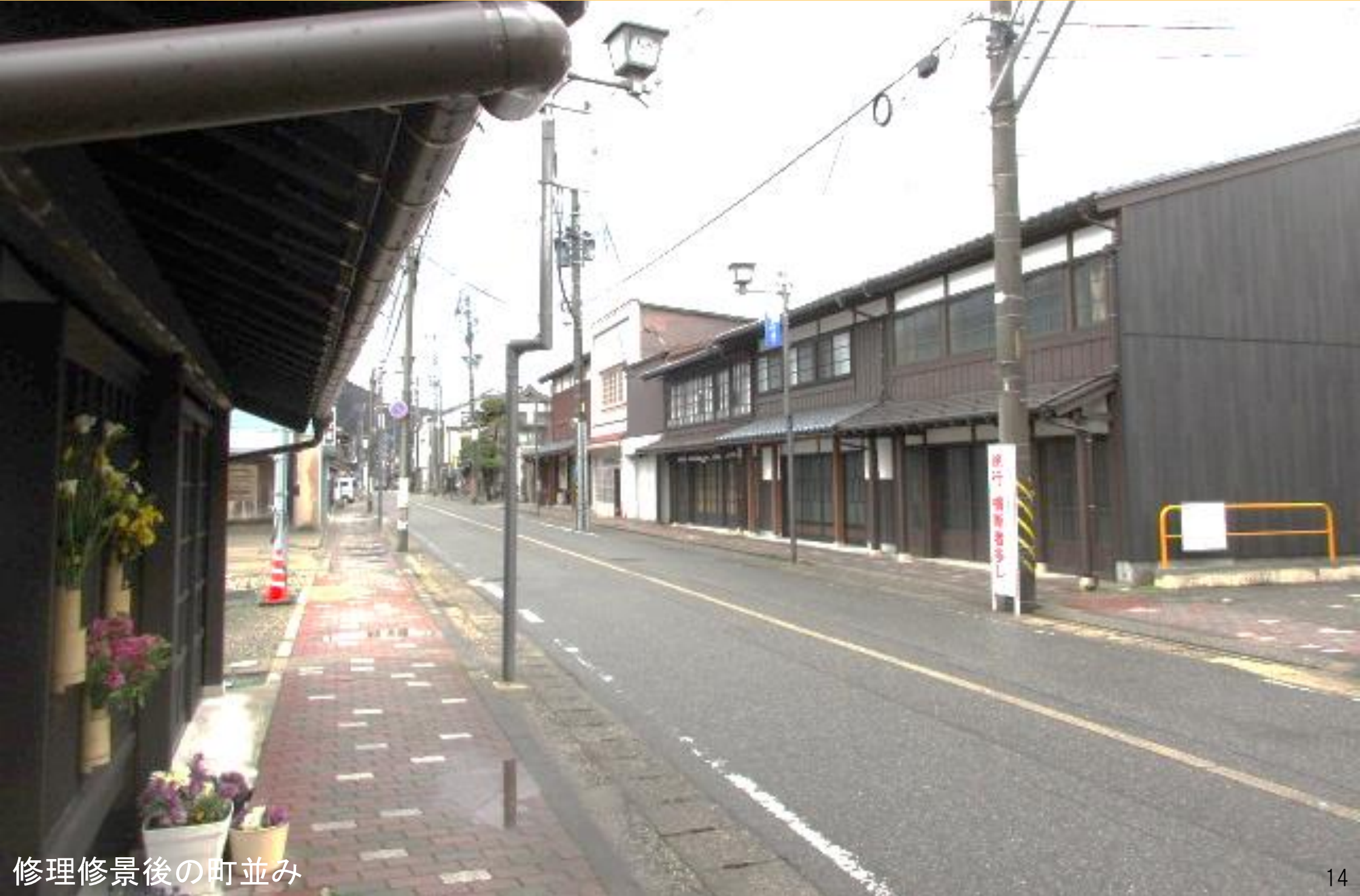
修理修景後の町並み