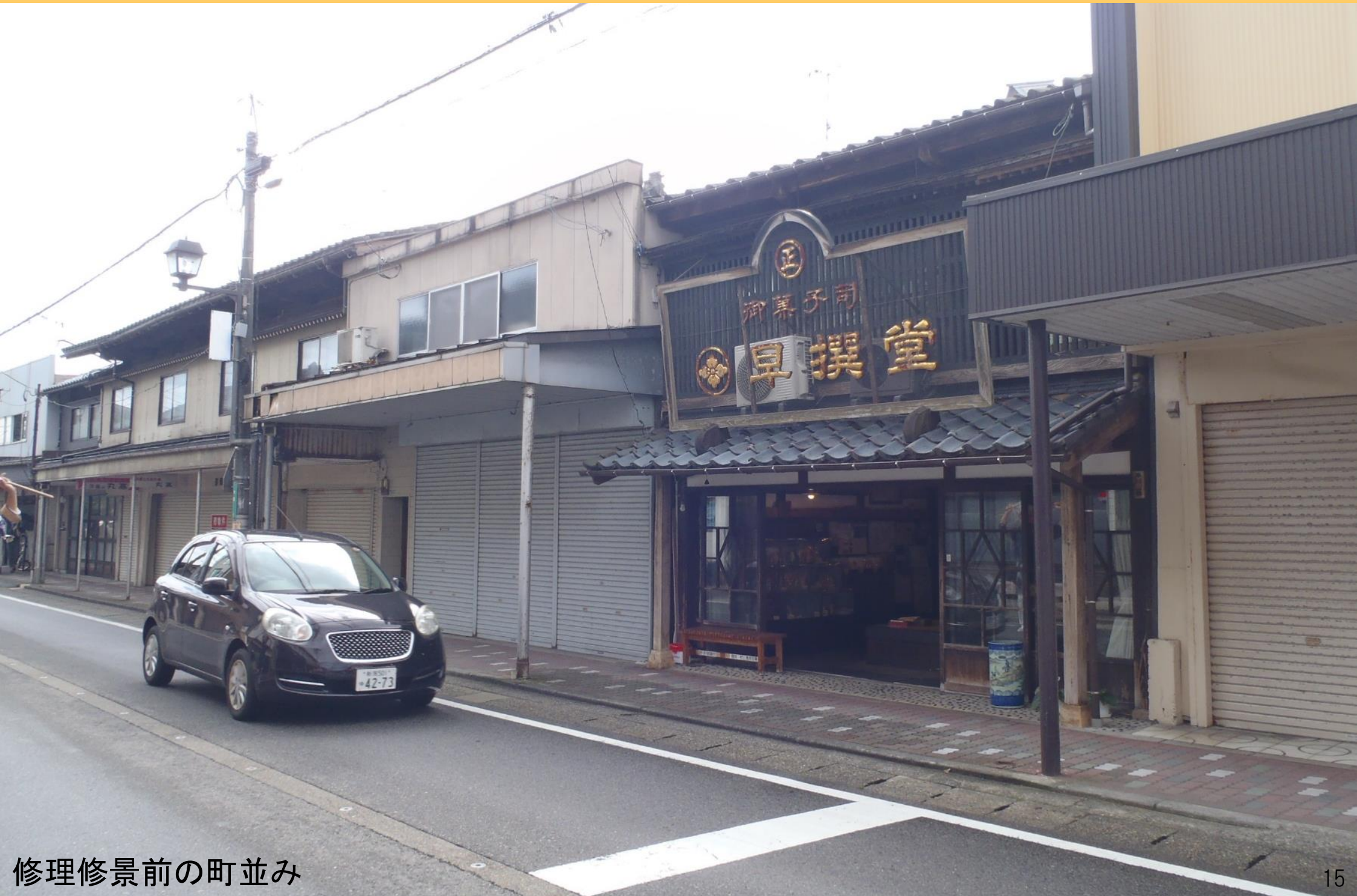
修理修景前の町並み