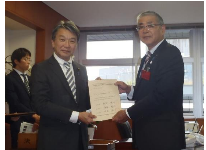
計画認定証授与式の様子(国交省内)