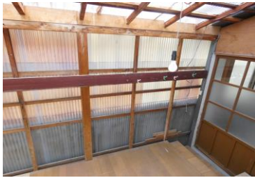
テラス（キッチン側）