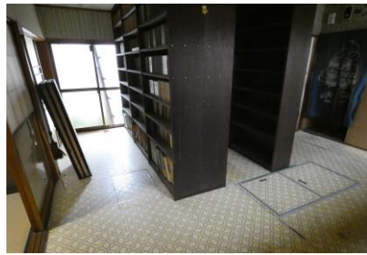
1階 洋室② (書棚)