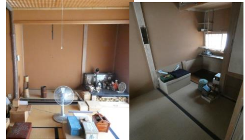
1階 和室⑤ (茶室)