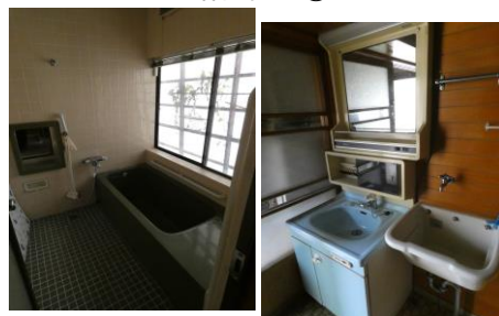
浴室・洗面脱衣所