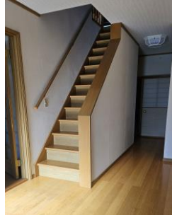
階段（階段下に収納があります）