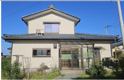
外観(左下部分に駐車スペースあり)