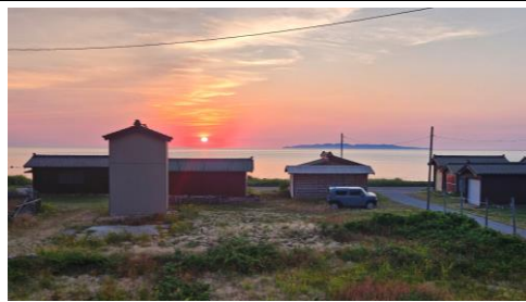
2階 和室③からの景色