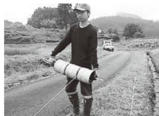
▲ 電気柵を設置しています