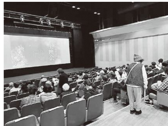
▲映画「人生フルーツ」上映会

今後も、住み慣れた地域でそれぞれが望む「最期」が迎えられるよう、市民・医療・介護関係者とともに取り組みを進めていきます。