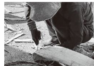
▲ 硬いしなの木の皮を剥ぐ様子 ▲ 試作品の数々