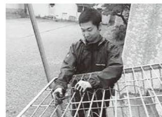
▲ 罟の手入れもしっかりと