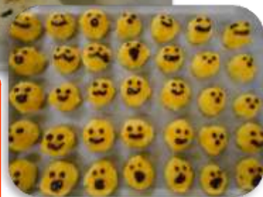
ココアで描いた表情豊かな顔のスイートポテト☆