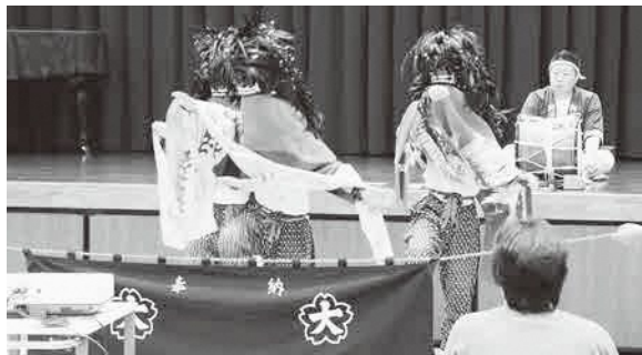
▲地区に受け継がれる伝統の獅子踊りを披露

次世代への伝統芸能の継承と世代間交流を目指して荒川地区青少年育成市民会議が開催している「あらかわっ子を育てる集い」。中学生や高校生による発表「私の主張」や子ども茶道のおもてなしに加え、伝統芸能「獅子踊り」について各保存会が、伝統芸能の楽しさや抱えている課題を語りました。保存会の人は「今後は、時代に合わせて形を変えながら、後世に受け継いでいきたい」と話していました。