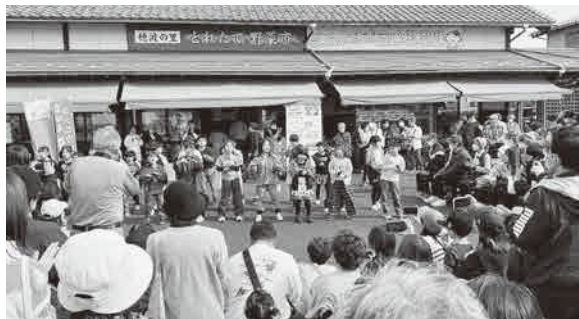
▲大勢の前でダンスを披露しました

道の駅の緑地帯には、100体を超えるユニークなかかしや園児、小中学生、地域の住民が育てたハロウィンかぼちゃ、ススキで作ったふくろうが並び、会場が秋色に彩られた2日間。小学生が考案した「神林ピザ」の販売やレクダンスの会の皆さんと小学生によるダンスの披露、つくたて餅のふるまい、ジャンボかぼちゃの重さコンテストなども行われ、会場には多くの笑顔があふれていました。