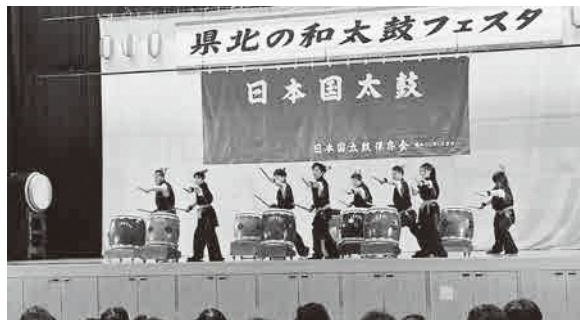
▲太鼓の鼓動に合わせて決めポーズ

「和太鼓で県北地域を元気に実行委員会」が主催したイベントに、瀬波温泉潮太鼓やえちごせきかわ太鼓龍泉会、日本国太鼓保存会の3団体が参加して、力強い演奏を披露しました。