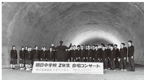
▲トンネル内で歌う朝日中学校2年生の皆さん

令和7年3月に完成した(仮称)4号トンネルで、合唱コンサートが行われました。朝日中学校の2年生が招待され、施工中である(仮称)2号トンネルを見学後、4号トンネルに移動して、「きみにとどけよう」「いつまでも」の2曲を披露。澄んだ歌声がトンネル内に響き渡り、子どもたちの笑顔とともに、感動を届けました。