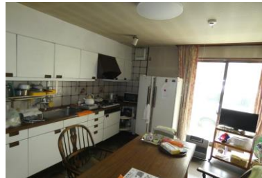
ダイニングキッチン