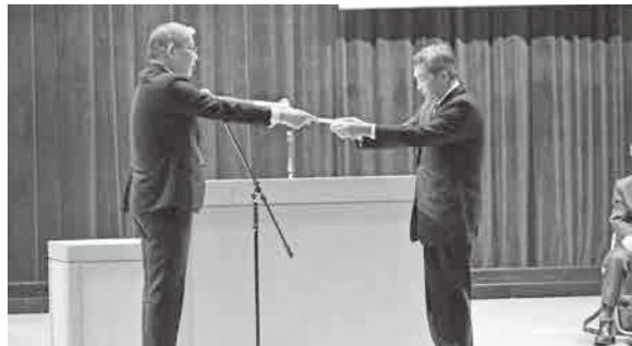
▲委嘱状が代表者に手渡されました

生活の中で気になることを聞き、地域の身近な相談相手として地域で活動する民生委員。今回、市から委嘱を受けた民生委員124人と主任児童委員11人は、令和7年12月からの3年間を任期として地域で活動します。