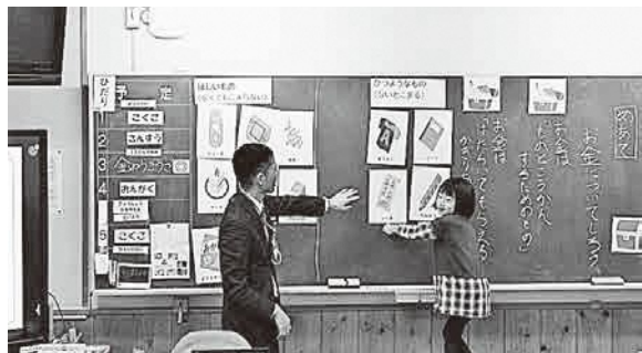
▲「無駄使い」について考えるクイズに挑戦する児童

さんぽく小学校で初めて行われたお金にまつわる授業に、1・2年生34人が参加しました。郵便局の方が講師を務め、お金の成り立ちの話やお金の無駄使いについてクイズ形式で学習。児童は楽しみながらも真剣に取り組んでいました。