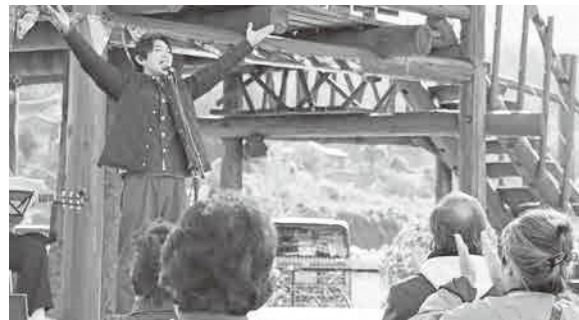
▲ツリーハウスのデッキで音楽演奏

また、荒川中学校3年生が企画し商品化したプリンやクッキー、スムージーが並び、大勢の来場者で賑わいました。