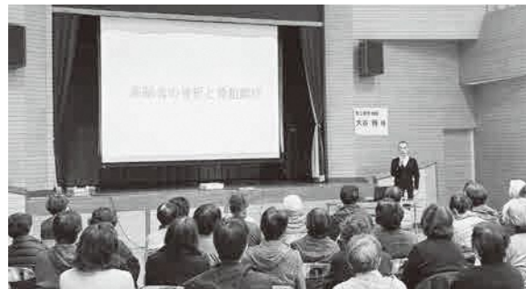
▲先生の話聞く参加者

参加された皆さんは、先生の話に耳を傾け、気になったことを先生に質問するなど、自分の健康を考える有意義な時間になりました。