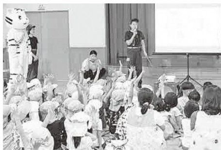
◀保育園での防災指導の様子