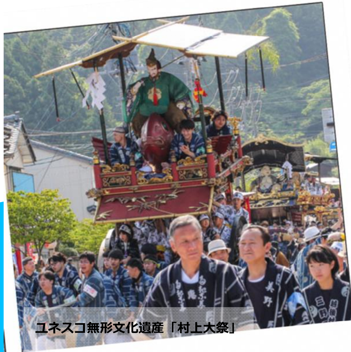
ユネスコ無形文化遺産「村上大祭」