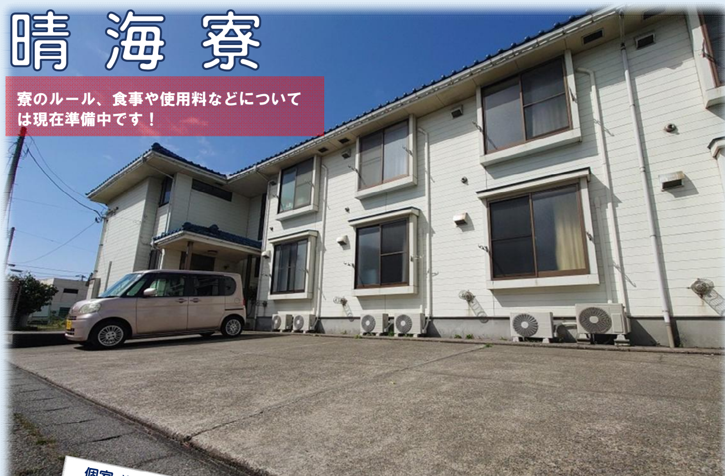
個室 ※プライバシーに配慮された空間