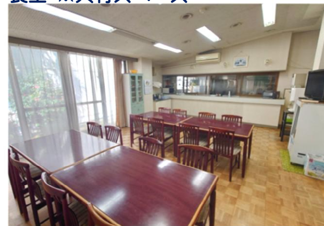
食堂 ※共有スペース